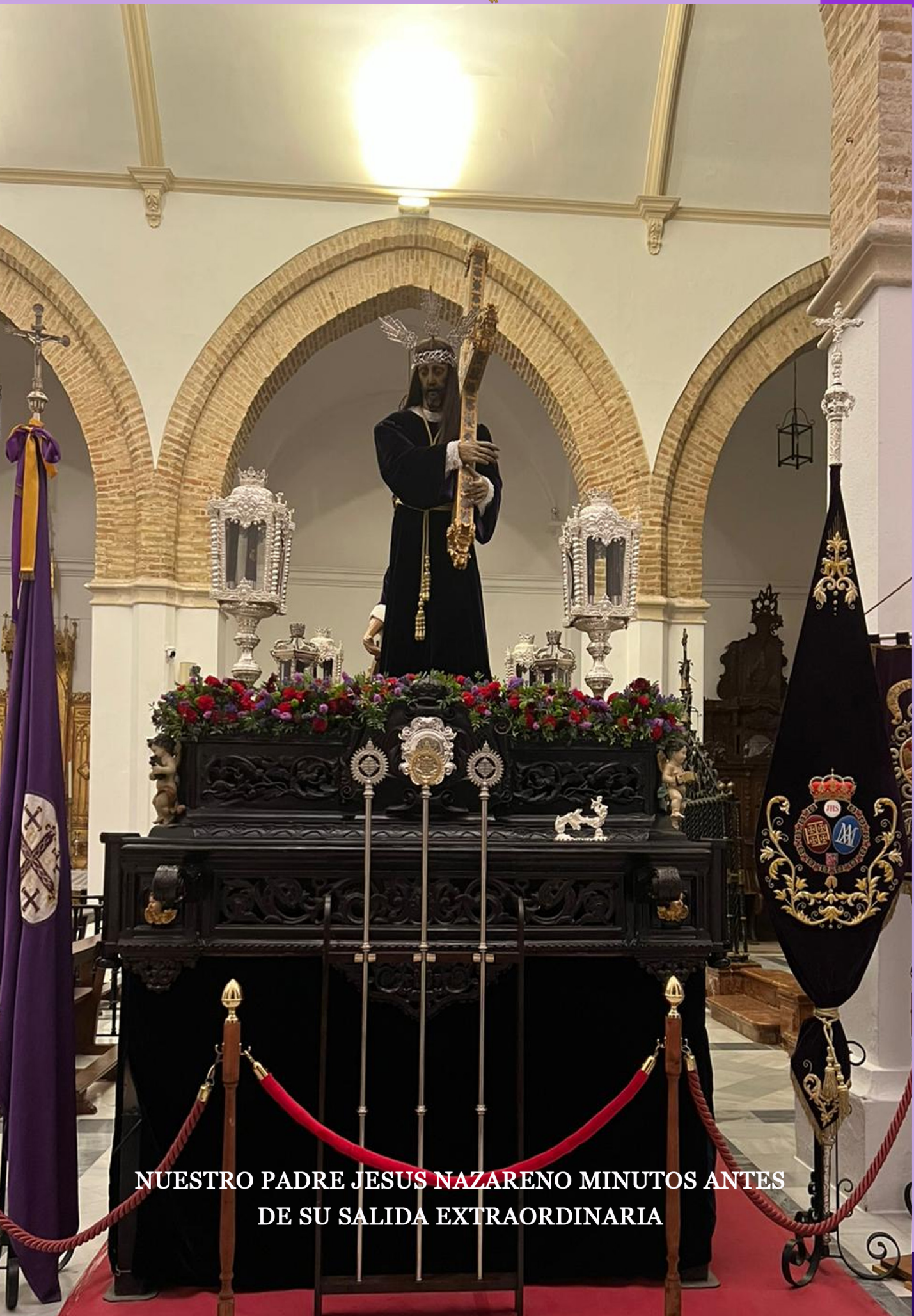
NUESTRO PADRE JESUS NAZARENO MINUTOS ANTES DE SU SALIDA EXTRAORDINARIA