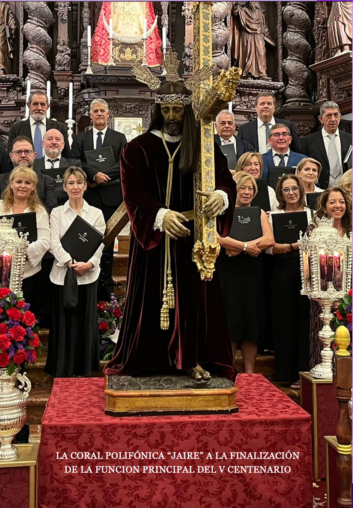
LA CORAL POLIFÓNICA "JAIRE" A LA FINALIZACIÓN DE LA FUNCION PRINCIPAL DEL V CENTENARIO